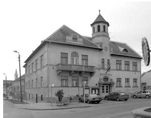
5. kép: Községháza

A második világháború után jelentős változások zajlottak le Nagycenken. 1950-ben tanácsrendszer jött létre, majd 1973-tól Fertőbozzal közös községi tanács alakult, melyhez később Pereszteg, Pinnye, Nagylózs és Sopronkövesd is csatlakozott. A megyei tanács engedélyével 1982-ben nagyközségi közös tanács alakult Nagycenk székhellyel.