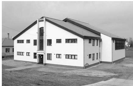
7. kép: Sportcsarnok

A politikai, gazdasági változások a község életében is jelentős szerepet játszottak. Nagycenk és közvetlen környéke gyülekezőhelye volt az egykori NDK-soknak, akik gyakran próbálkoztak innen elindulva a tiltott határátlépéssel. A nevezetes határáttörés után több itt hagyott gépkocsit szedtek össze az arra illetékesek. A falu névjelző táblájáról is eltűnt a „határőr község” felirat, az őr létszámát a minimálisra csökkentették.