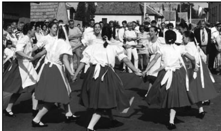
A cenki táncoslányok (és fiúk) a meghívott csoportokkal együtt idén is változatos műsorral várják az érdeklődőket.

rózsa Néptáncgyűttes és cite-razenekar, a vitnyédi Énekes Lenke Hagyományörző Néptáncgyűttes, valamint természetesen a cenki táncosok szerepelnek a rendezvényen. A május 15-én 19 órakor kezdődő rendezvényre minden érdeklődőt szeretettel várunk, kérjük jelenlétükkel is támogassák a cenki táncosokat.