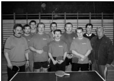
Fiatalok, és még fiatalabbak ping-pongoznak pöntekenként a Tornacsarnokban.

érni az együttes. A városi bajnokságban szintén jól megy a játék, ebben a sorozatban a tavaszi küzdelmek még nem kezdődtek el.