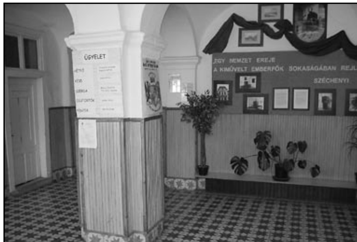
A jelenlegi előtér és a technika-terem egybenyitásával egy aula kialakítását tervezzük.