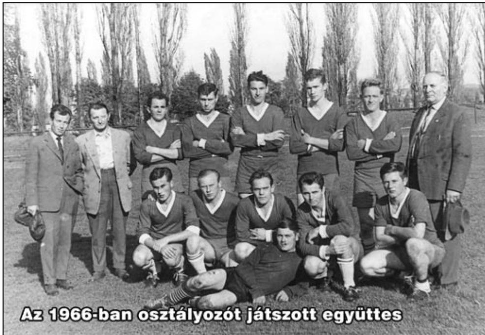
Az 1966-ban osztályozót játszott együttes

Így tehát a következő esztendőekben is a járási I-ben vívta mérkőzéseit a gárda. Az idegenbeli meccsekre az utazás ekkor már traktorral, vagy a TSZ teherautójával történt. Heti két edzéssel készültek a fiúk, az edzéslátogatottság jó volt, talán ennek is köszönhető, hogy sikerült megnyerni a bajnokságot. A játékosok többsége nagycenki volt, és az ifjúsági csapat állandó utánpótlást jelentett. A következő számban a hetvenes évek elejéről lesz szó. Köszönet Gráf Gyulának a segítségért, s továbbra is kérem, hogy segítsenek községünk focitörténetét feldolgozni!