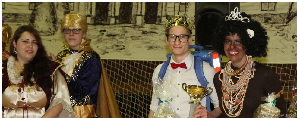
A III. Jelmezbálon a 2016-os bálkirálynő és bálkirály a tavalyi győztesektől vehette át az elismerést.