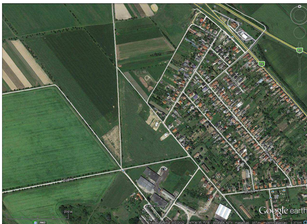
A tervezési terület légi fotója

A vizsgált tömbben az övezeti besorolás Gksz-ból Lke-ba módosul, amely alapján a lakótelkek kialakítását az önkormányzat megkezdi. A terület jellemzően északi irányból a Kövesmezei utca felől tárható fel további belső kiszolgáló utakon keresztül. Az új utcák közterületi szélességét 12m-ben javasoljuk meghatározni. A Cukorgyári utcai beépítés, illetve az új lakóövezet ölelésében, a terület déli oldalán marad a Hulladékudvar, melynek megközelítése az új lakóutcákon keresztül is történhet. Az ilyen jellegű teherforgalomtól a lakóövezetet azonban célszerű mentesíteni, és a hulladékudvar áruszállítását a 043 hrsz-ú külterületi út kiépítésével, déli irányból biztosítani.