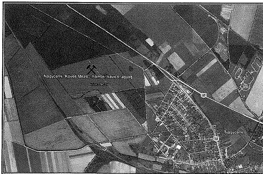
1. ábra: A terület megközelítése

A terület megközelíthető a település északi részén a 84-es számú főközlekedési útból lecsatlakozó földutakon keresztül.