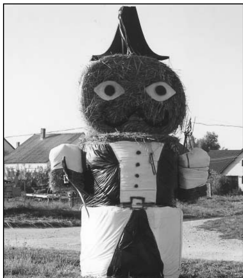
A 84. sz. és a 85. sz. utak kereszteződésében állították fel nagycenkiek a szüreti napokra felhívó szalmabábújukat