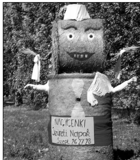
A kiscenkiek a 85. sz. főút és a fertőbozi út elágazásánál öltöztették ünnepibe szalma-babájukat