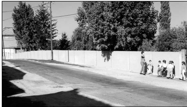
és ilyen lett